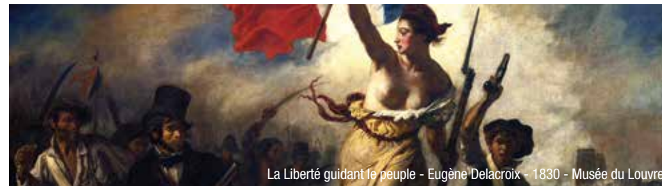
La Liberté guidant le peuple - Eugène Delacroix - 1830 - Musée du Louvre