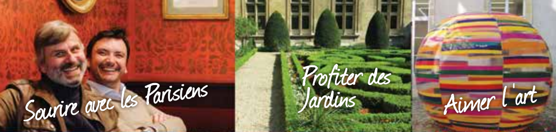
Sourire avec les Parisiens