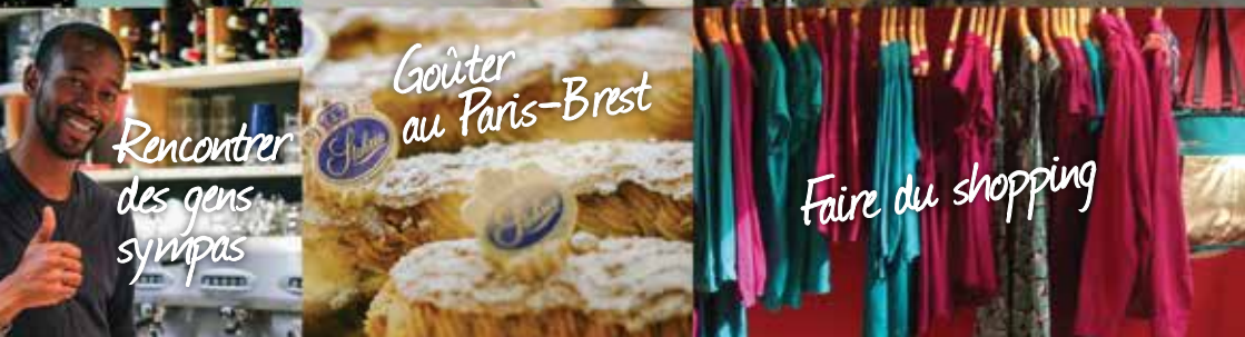
Rencontrer des gens sympas