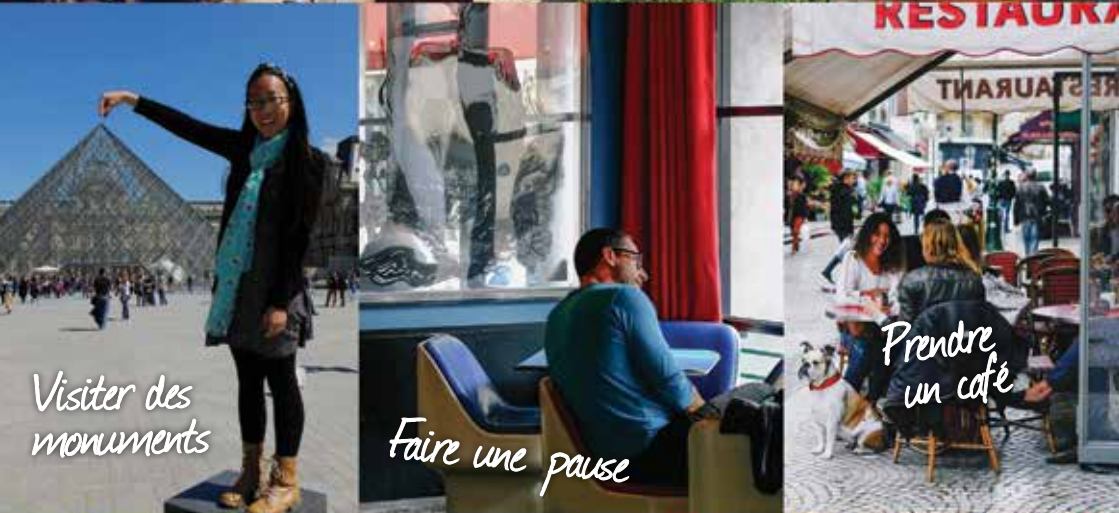
Visiter des monuments